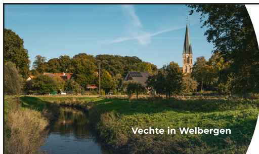
Vechte in Welbergen